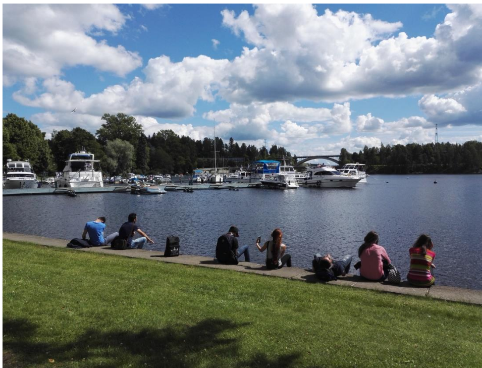
Kuva 1. Osallistujat taukoa viettämässä Heinolan vierailulla elokuussa 2016