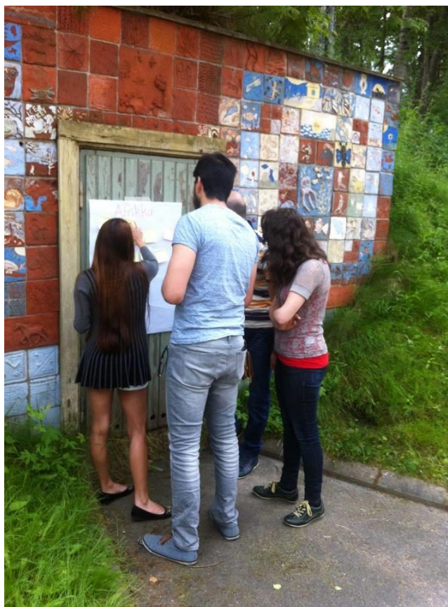
Kuva 7. Ryhmätoimintaa oli paljon myös perinteisen luokkahuoneen ulkopuolella

Työnhakuun ja työkuultuuriin Suomessa tutustuttiin käymällä läpi erilaisia työnhakemisen menetelmiä, työnhakukanavia ja työhaastatteluun valmistautumista. Työpaikkahaastattelua osallistujat harjoittelivat ohjaajan kanssa suomen kielellä. Harjoitukseen kuului myös ennakkotehtävä, johon sisältyi avoimen työhakemuksen kirjoittaminen ja sen toimittaminen projektin toimistoon ennen työpaikkahaastatteluharjoitusta. Näin osallistujaa autettiin löytämään itse työnhakukanavia, laatimaan työhakemus, valmistautumaan työhaastatteluun ja hankkimaan itselleen työpaikka. Sosiaalisen median hyödyntäminen työhaussa on tärkeää ja siksi tutustuttiin myös esim. LinkedIn –palveluun. Myös yrittäjyydestä yhtenä realistisena uravaihtoehtona järjestettiin teemapäiviä, joissa oli mm. maahanmuuttajataustaisia yrittäjiä jakamassa vertaiskokemuksiaan.