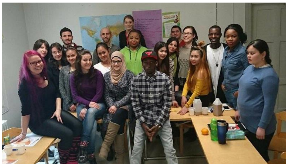
Kuva 8. Ryhmä elokuussa 2016, kuvassa myös kiusaamisasioiden tuki- ja neuvontakeskus Valopilkun vierailevat kokemusasiantuntijat

Ryhmään kuuluminen ja ryhmässä työskentely koettiin hyväksi tavaksi oppia ja samalla saa jaettava omia kokemuksiaan. Eri kulttuurit samassa ryhmässä eivät haitanneet, ja ryhmä toimi hyvin yhdessä. Haasteena koettiin kielitaidon vaihteleva taso osallistujien kesken. Toimintatavassa joitakin häiritsi hieman se, että välillä kieli vaihtui eikä ryhmässä puhuttu pelkästään suomea. Tutustuminen suomalaiseen kulttuuriin ja eri ammatteihin tuli vahvasti haastateltavilta esille. Työpaikkavierailut ja niistä sadut tiedot koettiin hyödyllisiksi. Liikunta- ja harrastustutustumiset koettiin tervetulleena vaihteluna. Hyötynä kurssista jokainen totesi olevan kielen oppimisen, jotta keskustelu ja kuuntelu mahdollistuvat suomalaisten kanssa. Myös kulttuurierot ovat nyt paremmin ymmärrettävissä ja ihmisten kohtaaminen koettiin kurssin ansiosta sujuvammaksi. Suurin osa oli sitä mieltä, että kurssilla opittuja asioita voi hyödyntää tulevaisuudessa työelämässä ja arjessa. Työpaikkavierailut koettiin erittäin mieluuisina ja hyödyllisinä sekä niiden koettiin helpottavan työnhakemista tulevaisuudessa.