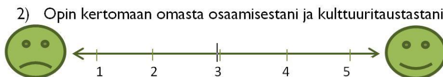
Kuva 10. Esimerkki palautelomakkeen kysymyksestä

Projektin päätöstilaisuuden yhteydessä 23.11.2016 projektiin aiemmat osallistujat arvioivat viisiasteisella Likert-asteikolla projektin merkitystä itselleen. Sama arviointikysely teetettiin myös marraskuussa 2016 projektiin osallistuneille.