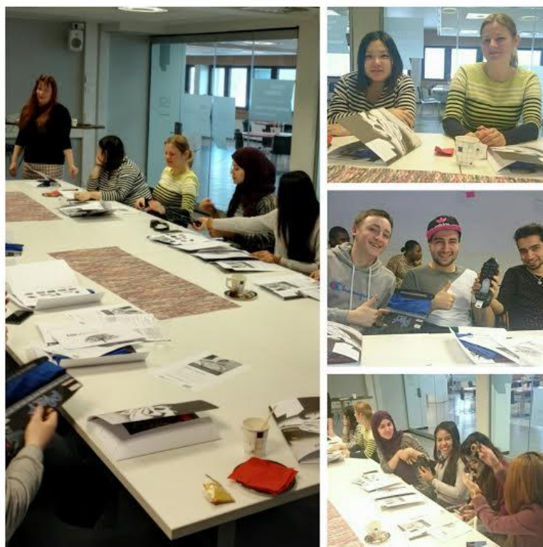
Kuva 4. Yritysvierailu helmikuussa 2016 ESA jakelut, Mediatalo ESA Oy

Teemallisilla ryhmäkeskusteluilla ja -tapaamisilla vahvistettiin suomalaisen työkuulttuurin tuntemusta, työ- ja opiskeluvälmiuksia, kulttuurien tuntemusta, itsetuntemusta sekä ryhmätyö- ja vuorovaikutustaitoja. Suomalaista työkuulttuuria esimerkiksi verrattiin osallistujien kotimaiden työkuulttuureihin ja pohdittiin mikä suomalaisille on tärkeää työnteossa. Ryhmäkeskusteluissa kuultiin myös vertaistarinoita omasta polusta koulutukseen ja työelämään, tutustuttiin itseopiskeluun ja verkkomateriaaleihin, rekryfirmoihin Suomessa, pohdittiin työnhaun ja perheen yhdistämistä ja oman osaamisen ja tavoitteiden tunnistamista ja sanoittamista esimerkiksi unelmakarttoja työstämällä.