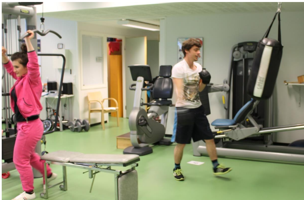
Kuva 13. Osallistujien oli mahdollista käyttää maksutta säännöllisesti Harjula-keskuksen kuntosalia. Osa vuoroista oli kaikille yhteisiä, osa erillisiä sukupuolen mukaan.

suurin osa ilmoitti esteestä. Lisäksi haasteena koettiin se, että naisiin oli vaikea saada kontaktia. Opiskelijaparitoiminta oli opiskelijoiden näkemysten mukaan heille itselleen mielekästä opiskelua, josta he oppivat paljon. Opiskelijaparitoiminta tuki hyvin myös suomalaisten opiskelijoiden ja maahanmuuttajien tutustumista.