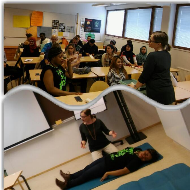
Kuva 5. Dilan järjestämin toimintoihin kuului esimerkiksi ensiaputaitojen harjoittelua

tehtävien suorittamisella kaupoissa, torilla ja muissa julkisissa paikoissa suomeksi. Myös muita ryhmätapaamisia ja esim. yritysvierailuja hyödynnettiin työelämäsanaston kerryttämisessä. Kielivalmennuksessa käytettiin pääasiassa suunnittelijan valmistelemia ja eri lähteistä keräämiä omia materiaaleja. Myös erilaisia pelillistämisen menetelmiä hyödynnettiin.