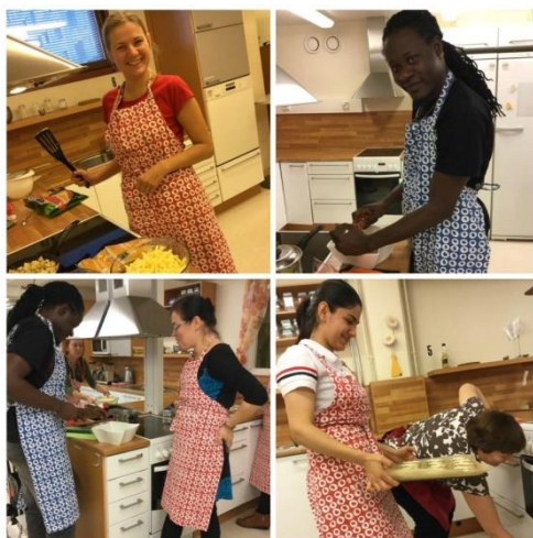
Kuva 3. Ryhmä valmistamassa yhteistä suomalaista ateriaa Dilan opetuskeittiössä

Dila ja heidän opiskelijansa järjestivät opiskelijaparityöskentelyä kaksi kokonaisuutta projektin aikana. Dilan opiskelijat ja projektin osallistujat tapasivat yhteisen ryhmätyöskentelyn jälkeen pareittain tai pienryhmissä vähintään neljä kertaa kukin. Tapaamisten teemat ja toiminnot vaihtelivat yhteisten kiinnostusten mukaan. Esimerkiksi opeteltiin yhdessä tietokoneen käyttöä, tutustuttiin Lahden historialliseen museoon, nuorisotiloihin, käytiin luistelemassa ja kahvilassa tutustumassa.