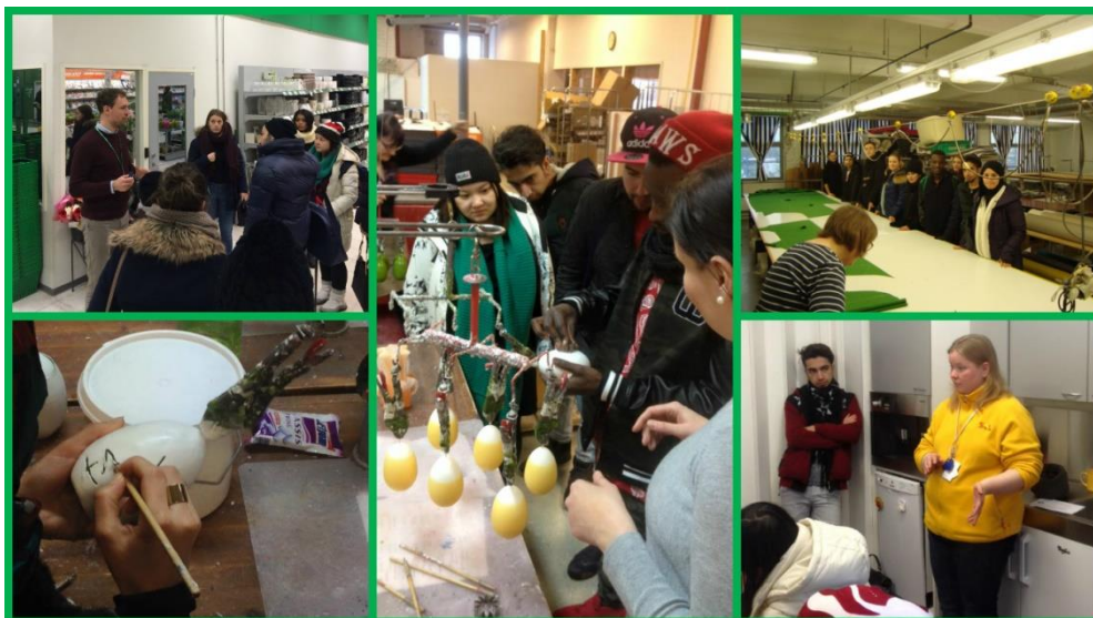
Kuva 11. Projektin aikana käytiin yritysvierailuilla tutustumassa moneen eri toimialaan

Kaikkea saatua palautetta kokonaisuutena tarkastellen, voidaan todeta osallistujilla olleen hyvin myönteinen käsitys projektin toimenpiteistä ja he kokivat projektista saamansa avun erittäin merkittäväksi oman työtulevaisuutensa kannalta.