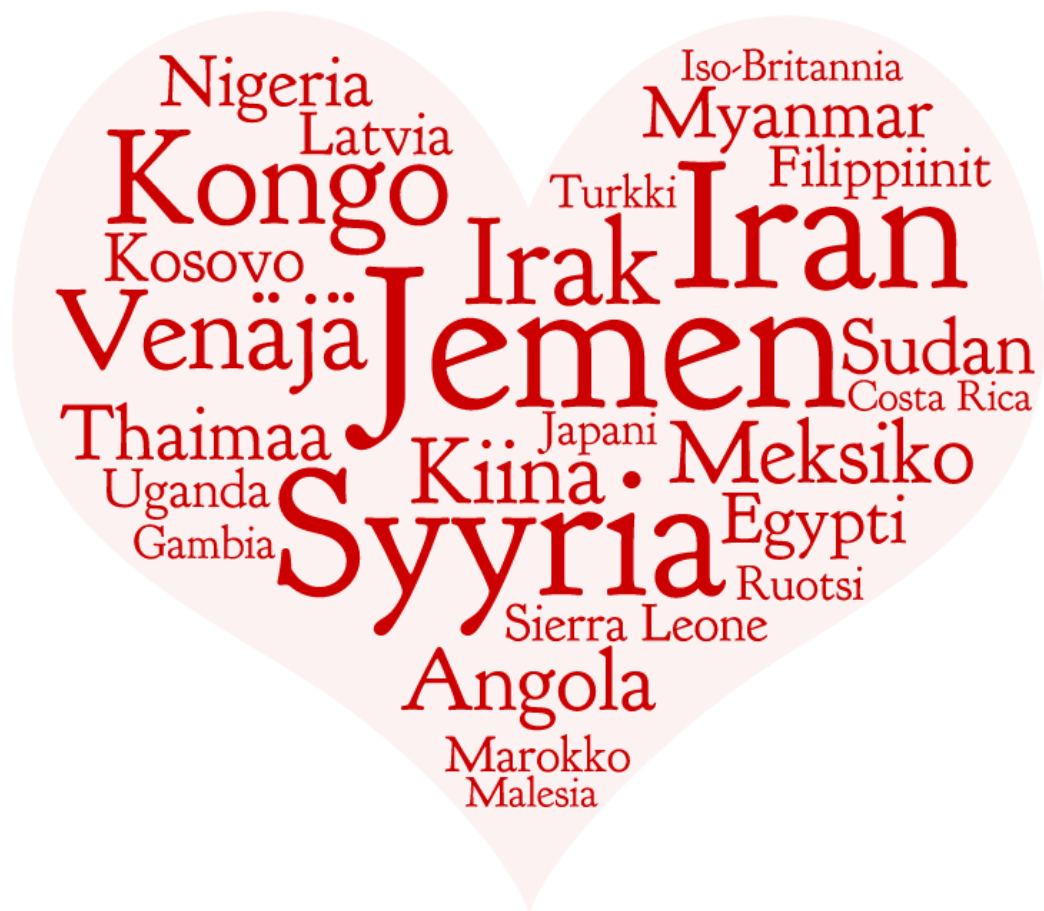
Kuva 12. Osallistujien kotimaat

Oman haasteensa toimintojen suunnitteluun ja toteuttamiseen toi osallistujien vaihtelevat aloitus- ja lopetusajankohdat projektissa. Projektin aikana suunniteltiin ja pilotoitiin seuraavassa luvussa esiteltävä tukitoiminnan palvelumalli, jotta osallistuja saisi mahdollisimman tavoitteellisesti hyötyä projektista, tuli hän sitten missä tahansa vaiheessa sykliä mukaan toimintaan.