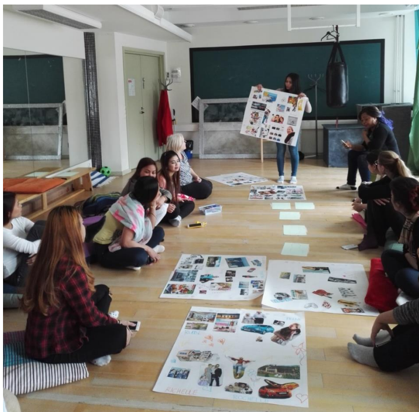
Kuva 2. Oman elämän unelma -työpajassa tehtiin unelmakarttoja