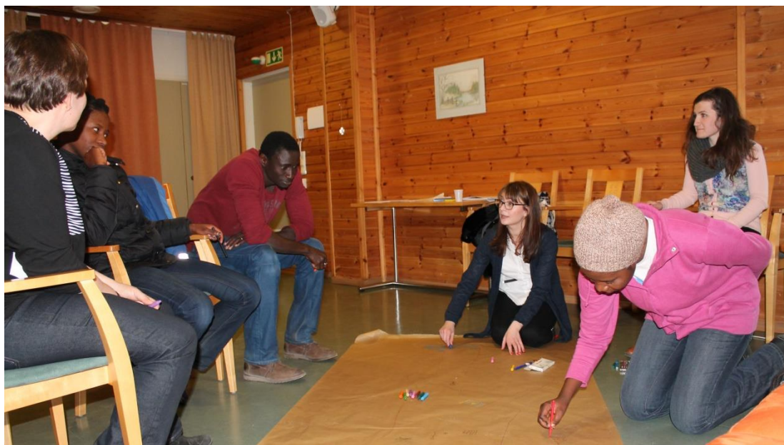
Kuva 6. Ryhmätilanteissa käytettiin monipuolisesti erilaisia luovia ja pelillistämisen menetelmiä

Kaikessa toiminnassa käytettiin laajasti erilaisia menetelmiä, kuten esimerkiksi Luovilla menetelmillä tuettiin osallistujia henkilökohtaisten vahvuuksien etsimisessä ja tunnistamisessa. Menetelminä käytettiin esim. pelillistämistä , draamaa ja itseilmaisua. Näin tuettiin osallistujien kykyä löytää omia piilossakin olevia vahvuuksia ja siten löytämään uusia mahdollisuuksia omassa työtulevaisuudessaan. Lisäksi tutustuttiin joihinkin omien vahvuuksien löytämisen työkaluihin ja ammatinvalintatesteihin.